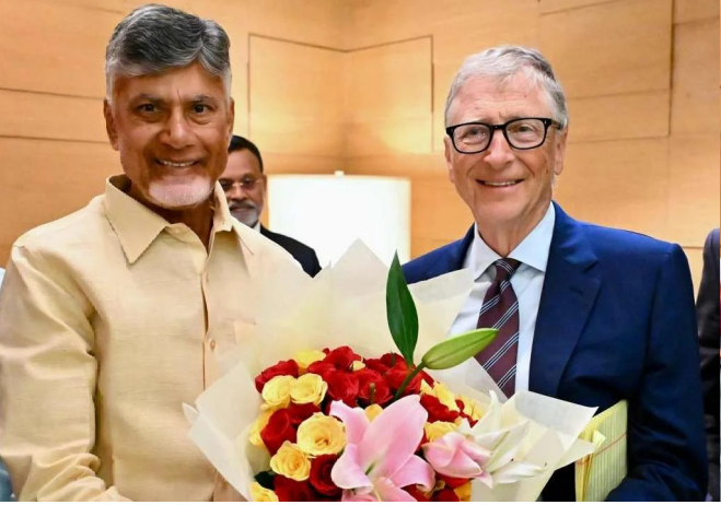
నాయుడు హయాంలో మైక్రోసాఫ్ట్ తో పాటు పలు అంతర్జాతీయ సంస్థల భాగస్వామ్యంతో ఏపీకి టెక్నాలజీ ప్రాతిపదికన అభివృద్ధి చేయాలని ప్రయత్నాలు జరిగాయి. అదే దారిలో గేట్స్ ఫౌండేషన్ తో ఒప్పందం కుదిరడం వల్ల ఆంధ్రప్రదేశ్ ప్రభుత్వానికి అనేక ప్రయోజనాలు ఉండనున్నాయి. ముఖ్యంగా ఆర్థిక సాంకేతికతను ఉపయోగించి వ్యవసాయ రంగాన్ని మరింత ముందుకు తీసుకెళ్లే అవకాశాలు మెరుగుపడతాయి. టాన్స్ ఫోర్స్ కార్యచరణ ఏమిటి? ఈ టాన్స్ ఫోర్స్ ముఖ్యంగా గేట్స్ ఫౌండేషన్ తో రాష్ట్ర ప్రభుత్వానికి మధ్య అనుసంధానకరణ వ్యవహరిస్తుంది. ఒప్పందం ద్వారా తీసుకురాబోయే కొత్త కార్యక్రమాలను సమీక్షించడం, వాటి అమలు తీరు పరిశీలించడం, అవసరమైన మార్పులను సూచించడం వంటి బాధ్యతలు ఈ బృందానికి అప్పగించనున్నారు. ఈ ఒప్పందం ద్వారా ఆంధ్రప్రదేశ్ లో ఆర్థిక సాంకేతికతను అందుబాటులోకి తీసుకువచ్చే ప్రభుత్వ చర్యలు పేర్కొంటున్నాయి. ముఖ్యంగా ఆర్టిఫిషియల్ ఇంటెలిజెన్స్, డిజిటల్ టెక్నాలజీ, ఆరోగ్య సంరక్షణ, వ్యవసాయ రంగాల్లో గేట్స్ ఫౌండేషన్ అనుభవాన్ని ఉపయోగించుకునేందుకు వీలు కలుగుతుంది. సాంకేతికతతో మెరుగైన భవిష్యత్తు ఈ ఒప్పందంతో ఏపీ సార్వత్రిక టెక్నాలజీ హబ్ గా మారే అవకాశాలు ఉన్నాయని, ఆంధ్రప్రదేశ్ అభివృద్ధికి ఇది మేలైన అవకాశమని పరిశీలకులు భావిస్తున్నారు. ముఖ్యంగా రాష్ట్రానికి అత్యుత్తమ సాంకేతిక పరిజ్ఞానం అందించడంలో బిల్ గేట్స్ ఫౌండేషన్ భాగస్వామ్యం కీలకంగా మారనుంది. ఈ టాన్స్ ఫోర్స్ రూపంలో రాష్ట్రాభివృద్ధికి మద్దతుగా బిల్ గేట్స్ ఫౌండేషన్ ప్రభుత్వం పని చేయనున్నది. దీంతో వ్యవసాయం, ఆరోగ్యరంగాల్లో పెద్ద ఎత్తున మార్పులు వచ్చే అవకాశాలు ఉన్నాయి.

అమరావతి, పలనాడు జ్యోతి : టాన్స్ ఫోర్స్ ఏర్పాటు చేస్తూ ఉత్తర్వులు జారీ ఆంధ్రప్రదేశ్ ప్రభుత్వానికి, బిల్ గేట్స్ ఫౌండేషన్ కు మధ్య కీలక ఒప్పందం కుదిరిన విషయం తెలిసిందే. రాష్ట్ర అభివృద్ధిలో భాగంగా ఒప్పందాన్ని మరింత ముందుకు తీసుకెళ్లేందుకు ఏపీ ప్రభుత్వం తాజాగా కీలక నిర్ణయం తీసుకుంది. గేట్స్ ఫౌండేషన్ కలిసి ఒప్పందాన్ని సమర్థవంతంగా అమలు చేయడానికి ప్రత్యేకంగా టాన్స్ ఫోర్స్ ఏర్పాటు చేయాలని ప్రభుత్వం నిర్ణయించింది. ఏపీ ప్రభుత్వం తాజాగా టాన్స్ ఫోర్స్ ఏర్పాటుకు ఉత్తర్వులు జారీ చేసింది. ఈ బృందంలో రాష్ట్ర ప్రభుత్వ ప్రతినిధులు, బిల్ గేట్స్ ఫౌండేషన్ సభ్యులు ఉంటారు. ఈ సహకారం ద్వారా పలు కీలక రంగాల్లో ప్రగతి సాధించడం లక్ష్యం. ముఖ్యంగా సువరిపాలన, వ్యవసాయం, ఆరోగ్యరంగం, ఆర్టిఫిషియల్ ఇంటెలిజెన్స్ వినియోగం, జీవన ప్రమాణాల మెరుగుదల వంటి అంశాలపై ఈ ఒప్పందం ప్రభావం చూపనుంది. ఢిల్లీలో చంద్రబాబు - బిల్ గేట్స్ భేటీ ఇటీవల, ముఖ్యమంత్రి చంద్రబాబు నాయుడు ఢిల్లీలో బిల్ గేట్స్ తో ప్రత్యేక సమావేశం నిర్వహించారు. ఈ సమావేశంలో రాష్ట్ర అభివృద్ధికి సంబంధించి పలు కీలక చర్యలు జరిగాయి. ముఖ్యంగా సాంకేతికతను ఉపయోగించి వ్యవసాయం, ఆరోగ్యరంగం, ఆర్టిఫిషియల్ ఇంటెలిజెన్స్ వినియోగం, జీవన ప్రమాణాల మెరుగుదల వంటి అంశాలపై ఈ ఒప్పందం ప్రభావం చూపనుంది. ఢిల్లీలో చంద్రబాబు - బిల్ గేట్స్ భేటీ ఇటీవల, ముఖ్యమంత్రి చంద్రబాబు నాయుడు ఢిల్లీలో బిల్ గేట్స్ తో ప్రత్యేక సమావేశం నిర్వహించారు. ఈ సమావేశంలో రాష్ట్ర అభివృద్ధికి సంబంధించి పలు కీలక చర్యలు జరిగాయి. ముఖ్యంగా సాంకేతికతను ఉపయోగించి వ్యవసాయం, ఆరోగ్యరంగం, ఆర్టిఫిషియల్ ఇంటెలిజెన్స్ వినియోగం, జీవన ప్రమాణాల మెరుగుదల వంటి అంశాలపై ఈ ఒప్పందం ప్రభావం చూపనుంది.