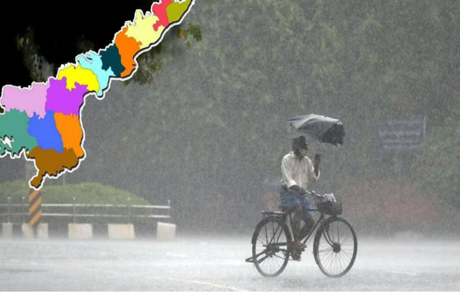
సమోద ధోరణి 2 నుండి 4 డిగ్రీల సెంటీగ్రేడ్ ఎక్కువగా ఉండే అవకాశముంది. గరిష్ట ఉష్ణోగ్రతలు సాధారణముగా కంటే 3 నుండి 4 డిగ్రీల సెంటీగ్రేడ్ ఎక్కువగా సమోదయ్యే అవకాశముంది. వడగాలులు హెచ్చరిక వడగాలులు, అధిక ఉష్ణోగ్రతల కారణంగా, ప్రజలు తగిన జాగ్రత్తలు తీసుకోవాలి. తగినంత నీరు త్రాగి, డిప్యూటీ సీఎం పవన్ కల్యాణ్ బయటకు వెళ్లండి, ముఖ్యంగా మధ్యాహ్నం సమయంలో. పిల్లలు, వృద్ధులు, గర్భిణీ స్త్రీలు ప్రత్యేక జాగ్రత్తలు తీసుకోవాలి. దుయచేసి తాజా వాతావరణ సమాచారాన్ని స్థానిక వాతావరణ శాఖ లేదా అధికారిక వార్తా మాధ్యమాల ద్వారా తెలుసుకోండి. ఎందుకంటే వాతావరణ పరిస్థితులు మారుతుండవచ్చు. ఉరుములు, మెరుపులు ఉన్నప్పుడు చెట్ల కింద లేదా బహిరంగ ప్రదేశాల్లో ఉండకండి. వీలైతే అవసరం వరకు ఇంట్లో ఉండండి. ఇంట్లో విద్యుత్ పరికరాలను ఆఫ్ చేయండి. లోతట్టు ప్రాంతాల్లో నివసించే వారు ముందు జాగ్రత్తగా ఉండండి. డ్రైనేజీ వ్యవస్థ దుర్బలన వస్తే, దాన్ని వెంటనే శుభ్రం చేయించుకోండి. ఫ్లడ్ హెచ్చరికలుంటే అవసరమైన వస్తువులు సిద్ధం చేసుకోండి.

అమరావతి, పలనాడు జ్యోతి : ఆంధ్రప్రదేశ్ లో రాజోయే మూడు రోజుల్లో ఆంధ్రప్రదేశ్ లో వాతావరణ పరిస్థితులు ప్రాంతాలవారీగా మారుతూ ఉంటాయని సూచనలు ఇచ్చింది వివక్షలు నిర్వహణ సంస్థ. వచ్చే 3 రోజుల్లో ఈ ప్రాంతాల్లో వడగాలులు ఉండనున్నాయి. దక్షిణ ఛత్తీస్ గఢ్ నుంచి గల్ఫ్ ఆఫ్ మన్నార్ వరకు ఉన్న నిన్నటి ఉత్తర-దక్షిణ డ్రోజి ఇప్పుడు ఉత్తర మధ్య మహారాష్ట్ర నుండి ఉత్తర కేరళ వరకు అంతర్గత కర్కాటక మీదుగా సగటు సముద్ర మట్టానికి 0.9 కి.మీ ఎత్తు వరకు విస్తరించి ఉన్నది. ఉత్తర కోస్తా ఆంధ్రప్రదేశ్ యానా లో ఈరోజు కొన్ని ప్రాంతాల్లో తేలికపాటి నుండి మోస్తరు వర్షాలు లేదా ఉరుములతో కూడిన జల్లులు కురిసే అవకాశముంది. ఉరుములతో కూడిన మెరుపులు కూడా సంభవించవచ్చు? రేపు, ఎల్లయి: పొడి వాతావరణం కొనసాగుతుంది. గరిష్ట ఉష్ణోగ్రతలు సాధారణం కంటే 2 నుండి 4 డిగ్రీల సెంటీగ్రేడ్ ఎక్కువగా సమోదయ్యే అవకాశముంది.? దక్షిణ కోస్తా ఆంధ్ర పొడి వాతావరణం ఏర్పడే అవకాశం ఉంది. గరిష్ట ఉష్ణోగ్రతలు