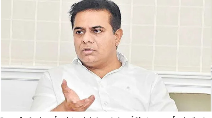
పెట్టుబడి సాయం చేశామని ప్రభుత్వం స్పష్టం చేస్తోంది. అయితే ఈ సాయం అందరికీ అందలేదంటూ ప్రతిపక్షం బీఆర్ఎస్ ఆరోపిస్తుంది. ఈ నేపథ్యంలో రేవంత్ రెడ్డి ప్రాతినిధ్యం వహిస్తున్న కొడంగల్ లో కానీ.. తాను ప్రాతినిధ్యం వహిస్తున్న సిరిసిల్లలో కానీ పర్యటిస్తాం. ఈ రెండు నియోజకవర్గాల్లో రైతులకు రైతు బంధు సాయం సగదు అందిస్తున్నామని అయితే తాను రాజకీయాల నుంచి శాశ్వతంగా తప్పుకుంటానని సీఎం రేవంత్ రెడ్డికి కేటీఆర్ సవాల్ విసిరారు. మరోవైపు ఎన్నికల సందర్భంగా పలు హామీలు ఇచ్చి.. అధికారంలోకి వచ్చిన అనంతరం వాటిని అమలు చేయడం లేదంటూ అధికార కాంగ్రెస్ నేతలపై బీఆర్ఎస్ నేతలు విమర్శలు గుప్పిస్తున్నారు. ఈ నేపథ్యంలో గురువారం తెలంగాణ అసెంబ్లీలో సీఎం రేవంత్ రెడ్డి కీలక వ్యాఖ్యలు చేశారు. తమ ప్రభుత్వంలో అన్ని పథకాలు వల్ల ప్రజలు లబ్ధి పొందుతున్నారన్నారు. అలాగే ఈ బీఆర్ఎస్ పాలనలో రూ. లక్షల కొట్లు అప్పులు చేశారని ఆరోపించారు. ఈ నేపథ్యంలో మాజీ మంత్రి కేటీఆర్ తనవైన శైలిలో స్పందించారు. ఆ క్రమంలో సీఎం రేవంత్ రెడ్డికి కేటీఆర్ సవాల్ విసిరారు.