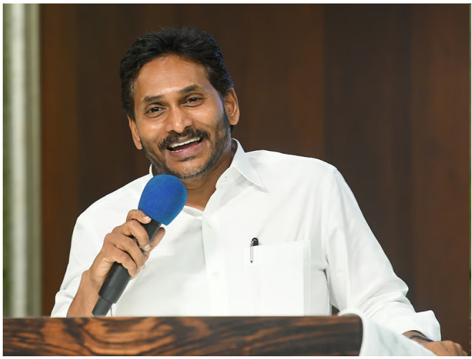
ఉన్న 12.98 హెక్టార్ల భూమిని అటవీశాఖ నుంచి మినహాయించాలని, ఆ క్షేత్రానికి రిజర్వ్ చేయాలని, డిసీకోసం ఎలాంటి పరిహారం కోరనా, ఎలాంటి అంక్షలను విధించినా తు.చ.తప్పక పాటిస్తామని లేఖలో చాలా స్పష్టంగా చెప్పాం. మా ప్రయత్నాలతో కేంద్రం తన చర్యలను నిలుపుదల చేసింది. మా బద్దేశ్ పాలనలో కాశీనాయన క్షేత్రానికి వ్యతిరేకంగా ఎవ్వరూ ఒక్క చర్యకూడా తీసుకోలేదు.

అమరావతి, పలనాడు జ్యోతి : హిందూ ధర్మం, ఆలయాల పరిరక్షణపై మాట్లాడే హక్కు డిప్యూటీ సీఎం పవన్ కల్యాణ్ కు లేదని మాజీ సీఎం వైఎస్ జగన్ అన్నారు. కశీనాయన క్షేత్రాన్ని కూల్చేస్తుంటే పవన్ ఒక్క మాట కూడా మాట్లాడలేదని ఎక్స్ ప్రెస్ మండిపడ్డారు. ఆలయాల పట్ల తమకు ఉన్న చిత్తశుద్ధి కూటమి ప్రభుత్వానికి లేదన్నారు. అధికారంలోకి వచ్చిన వెంటనే కాశీనాయన ఆలయాన్ని కూటమి ప్రభుత్వం కూలుస్తోంది. ఆ ఆలయ అభివృద్ధికి వైసీపీ ప్రభుత్వం ఎంతో కృషి చేసిందని వైఎస్ జగన్ పేర్కొన్నారు. అధ్యాత్మిక శోభ విలసిల్లింది? ఎవరి హయాంలో దేవుడు అంటే భక్తి, భయం ఉన్నది ఎవరికి? ఎవరి హయాంలో ఆధ్యాత్మిక శోభ విలసిల్లింది? ఎవరి హయాంలో హైందవ ధర్మాన్ని పరిరక్షించారు? కూటమి ప్రభుత్వం వచ్చిన తర్వాత ప్రసిద్ధ కాశీనాయన క్షేత్రంలో కూల్చివేతలు, రాష్ట్రంలో ఆలయాలపైన, హిందూ ధర్మంపై జరుగుతున్న దారుణాలకు ప్రత్యక్ష సాక్ష్యాలు కావా?" కూటమి ప్రభుత్వాన్ని వైఎస్ జగన్ ప్రశ్నించారు. "అటవీ ప్రాంతంలో ఉన్న కాశీనాయన క్షేత్రంలో నిర్మాణాల నిలిపివేత, వాటి తొలగింపుపై ఆగస్టు7, 2023న కేంద్ర మర్యాదలను, అటవీ మంత్రిత్వశాఖ అదేశాలు ఇచ్చినా, ఆ క్షేత్ర పరిరక్షణకు మా ప్రభుత్వం సదుపాయాలను మాట వాస్తవం కాదా?" మా పాలనలో కాశీనాయన క్షేత్రానికి వ్యతిరేకంగా ఒక్క చర్య తీసుకోలేదు అదే నెల ఆగస్టు 18, 2023న అప్పటి కేంద్ర అటవీశాఖ మంత్రి భూపేంద్ర యాదవ్ కి ముఖ్యమంత్రి హెలాడోల్ నేనే స్వయంగా లేఖరాసి కాశీనాయన క్షేత్రం