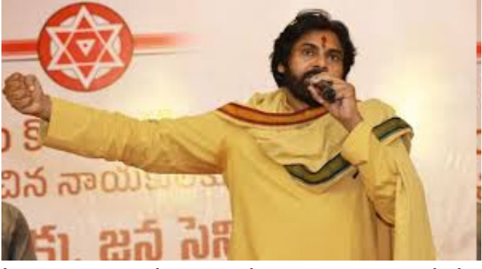
నీటి సమస్యలు పరిష్కరించేందుకు ఇప్పటికే పురపాలక శాఖ అధికారులతో సమీక్ష చేశాను.. పిఠాపురం- ఉప్పాడ రైల్వే గేటు వద్ద ట్రాఫిక్ సమస్యకు శాశ్వత పరిష్కారం చూపగలిగాం.. రూ.59.7 కోట్లు నిధులు మంజూరయ్యాయని వెల్లడించారు.. ఇక, ఉప్పాడి హామీ పథకంలో రూ.40.2 కోట్లతో 444 రోడ్లు పనులు చేపట్టాం.. 431 గోకులాలు పిఠాపురం నియోజకవర్గానికి ఇచ్చాం.. పిఠాపురంలో ప్రభుత్వ ఆసుపత్రిని సీపావీసీ నుంచి ఏరియా ఆసుపత్రి స్థాయికి పెంచాం.. అందుకు అనుగుణంగా రూ.38.32 కోట్లు నిధులు వచ్చాయని సమీక్ష సమావేశంలో వెల్లడించారు డిప్యూటీ సీఎం పవన్ కల్యాణ్.

పిఠాపురం అభివృద్ధిపై డిప్యూటీ సీఎం పవన్ కల్యాణ్ ఫోకస్.. పిఠాపురంలో పర్యటించిన డిప్యూటీ సీఎం పేషి అధికారులు.. పిఠాపురం అర్బన్ డెవలప్మెంట్ అధికారులతో ప్రత్యేకంగా భేటీ.. ఇక, పై ప్రతి వారం రివ్యూ చేస్తానన్న పవన్ కల్యాణ్.. అమరావతి, పలనాడు జ్యోతి : పిఠాపురం అభివృద్ధిపై ఫోకస్ పెట్టారు డిప్యూటీ సీఎం పవన్ కల్యాణ్.. ఇకపై వరుసగా సమీక్షలు నిర్వహించాలనే నిర్ణయానికి వచ్చారు.. పిఠాపురం నియోజకవర్గంలో పర్యటించిన డిప్యూటీ సీఎం పేషి అధికారులు, పిఠాపురం అర్బన్ డెవలప్మెంట్ అధికారులతో ఈ రోజు నియోజకవర్గంలో జరుగుతున్న అభివృద్ధి కార్యక్రమాలపై రివ్యూ నిర్వహించారు పవన్. అధికారులతో రివ్యూలో కీలక సూచనలు చేశారు.. పిఠాపురం నియోజక వర్గ పరిధిలో నాలుగు పోలీస్ స్టేషన్లలో ఉన్న పరిస్థితిపై ఇంటెలిజెన్స్ నివేదిక తీసుకోవాలని ఆదేశించారు.. అవినీతికి పాల్పడుతున్న పోలీసు అధికారుల మూలంగా పోలీస్ శాఖ మలకన అవుతోందన్న ఆయన.. ప్రతివారం పిఠాపురం అభివృద్ధిపై సమీక్ష చేస్తానని తెలిపారు. అధికారులు క్షేత్ర స్థాయిలో పురోగతిని పరిశీలించాలని సూచించారు డిప్యూటీ సీఎం పవన్.. శాంతిభద్రతల పరిరక్షణపై ప్రత్యేక దృష్టి పెట్టాలన్న ఆయన.. వేసవిలో నీటి సరఫరాకు ఎలాంటి అంతరాయం ఉండకూడదు.. సమగ్ర స్థాయిలో ట్యాంక్స్ దగ్గర తనిఖీలు చేయాలన్నారు. అవుట్ 2.0 ద్వారా పిఠాపురం పట్టణంలో తాగు