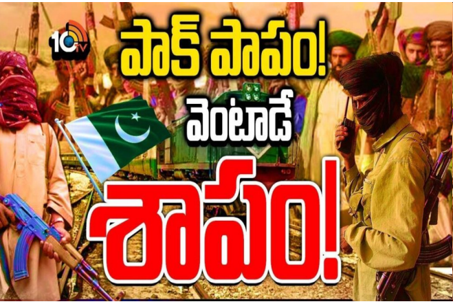
ఆగ్నేయ ఇరాన్, దక్షిణ అఫ్ఘానిస్తాన్ లో వ్యాపించి ఉంది. ఐతే పాకిస్తాన్ నుంచి విడిపోయి బలూచిస్తాన్ ప్రత్యేక ప్రాంతంగా ఏర్పడాలని.. తమకు స్వయం నిర్ణయాధికారం ఉండాలని డిమాండ్ చేస్తోంది. 2వేల సంవత్సరంలో ఏర్పాటుయిన బలూచిస్తాన్ ఆర్మీని.. పాకిస్తాన్, అమెరికా ఉగ్రవాద సంస్థగా ప్రకటించారు. 2011 నుంచి బలూచి ఆర్మీ యాక్టివ్ అయింది. మజీద్ బ్రిగేడ్ పేరుతో సూపర్ డెల్టా క్రియేట్ చేసి పాక్ వెన్నులో వణుకు వుట్టిస్తోంది ఆర్మీ.

పాకిస్తాన్, పలనాడు జ్యోతి : బలూచిస్తాన్ ఆర్మీ.. చైనా, పాక్ దేశాలకు నిద్రలేకుండా చేస్తున్న పేరు ఇది. చంపడం, చాపడం మాత్రమే తెలిసిన సైన్యం ఇది. హక్కుల కోసం అంటూ యుద్ధం మొదలుపెట్టిన బలూచి ఆర్మీ.. రక్తపాతం సృష్టిస్తోంది. పాక్ లో రైలును హైజాక్ చేసి వంద మందికి పైగా ప్రయాణీకులను బందిలగా చేయడం ఇప్పుడు సంచలనంగా మారింది. ఆసలు ఎవరి బలూచి లిబరేషన్ ఆర్మీ ఫైటర్లు. ఎందుకు రైలును హైజాక్ చేశారు. అసలు వాళ్ల డిమాండ్లు ఏంటి. పాక్ ప్రభుత్వంతో దశాబ్దాలుగా ఎందుకు పోరాటం చేస్తున్నారు.. చైనా పేరు చెప్పే ఎందుకు కోపంతో ఊగిపోతున్నారు..