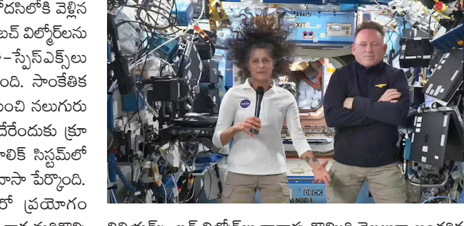
విలియమ్స్, బస్ విల్కోర్లను దాచుకుంటూ తొమ్మిది నెలలుగా అంతరిక్ష కేంద్రంలోనే చిక్కుకుపోయిన విషయం తెలిసింది.

ఘోరిదా : పలనాడు జ్యోతి : మాడోసో రోడనిలోకి వెళ్లిన భారత సంతతి వ్యూహావి సునీతా విలియమ్స్, బస్ విల్కోర్లను భూమిపైకి తిరిగి తీసుకొచ్చేందుకు నాసా-స్పేస్ ఎక్స్ ప్లూ ప్రయోగించిన క్రూ 10 మిషన్ వాయిదా పడింది. సాంకేతిక సమస్య తలెత్తడంతో అమెరికాలోని ఘోరిదా నుంచి నలుగురు వ్యూహామలతో ఫాల్కన్ 9 రాకెట్ బయలుదేరేందుకు క్రూ 10 మిషన్ ప్రయాణం నిలిచిపోయింది. హైథాలిక్ సిస్టమ్ లో సమస్య ఉత్పన్నం కావడంతో దీన్ని ఆపేసినట్లు నాసా పేర్కొంది. సమస్యను పరిష్కరించే కా వారంలో మరో ప్రయాణం చేయనున్నట్లు తెలిపింది. దీంతో వ్యూహామల రాక మరికొన్ని రోజులు ఆలస్యం కానున్నట్లు తెలుస్తోంది. కాగా సునీతా