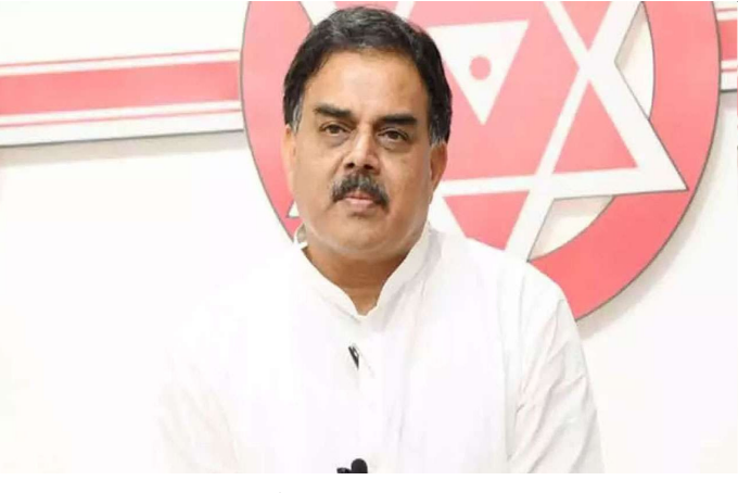
చెప్పడానికి ఈ సభ ఏర్పాటు చేసామని వివరించారు.

పిఠాపురం ప్రజలకు కృతజ్ఞతలు పిఠాపురం పవన్ కళ్యాణ్ అడ్డా అన్నారు. వర్ష వాలా సీనియర్ పాలిటిషియన్ అని కొనియాడారు. వాళ్ళ పార్టీ ఆయన విషయం లో నిర్ణయం తీసుకుంటుంది. ఆ పార్టీ అంతర్గత వ్యవహారం అన్నారు. వర్ష ని గౌరవించడం లో చూకు ఎటువంటి అభ్యంతరం లేదని క్లారిటీ ఇచ్చారు. వర్ష కి చెక్ పెట్టాలన్న అవసరం ఏమీ ఉంటుందని చురకలు అంటించారు. పవన్ సెక్యూరిటీ విషయంలో డిపార్ట్మెంట్ తో పాటు పార్టీ పరంగా మేము కూడా చూసుకుంటామని ప్రకటించారు. సభా ప్రాంగణం లో 75 నిసి కెమెరాలు ఏర్పాటు చేస్తామన్నారు. పిఠాపురం ప్రజలకు కృతజ్ఞతలు